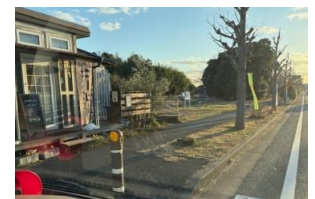
あすみ堂の前交差点付近

いきなり全面的に、ではなく、交差点、お店の前とか、から少しづつ、どなたでもやれるよう、市（管轄：土木管理課）にヒアリング中です。⇒「アプトプ ぐら」申請予定（参考：第二自治会では、特定の道路の美観活動対象に申請活動中と聞いています）