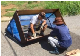
製作中の常設箱型(黒澤組)