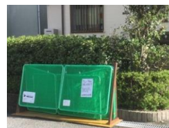
No.40(88, 90街区) 9/5~9/16