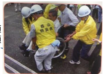
自主防災組織による要援護者避難訓練

自治会に入り、自治会を通じて、日々の繋がり、情報連携、情報集約が いざという時に貴重な助けになると思います